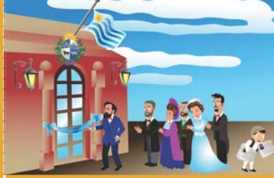
Inauguración de la Escuela rural N° 5 en Tacuarembó, a fines del siglo XIX.

Los principios defendidos por Varela aún siguen vigentes.